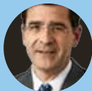
Shelby R. du Pasquier Lenz & Staehelin