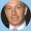
Rolf Watter Bär & Karrer

Das Gesellschaftsrecht beschäftigt sich insbesondere mit der Entstehung und Beendigung, der Organisation und der Finanzierung von Unternehmen. Typische Beratungsleistungen ergeben sich in der Gründungsphase und bei der Strukturierung von Gesellschaften, bei der Erstellung von rechtlichen Dokumenten (z.B. Kauf- und Handelsverträgen) sowie der Entwicklung rechtlicher Lösungen im Zusammenhang mit Marktstrategien.